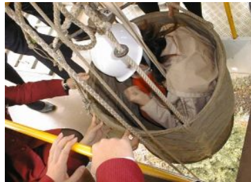
停電時運転（予備エンジン）訓練。