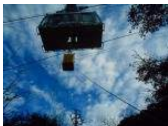
停電時運転(予備エンジン)訓練