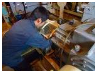
停電時運転(予備エンジン)訓練