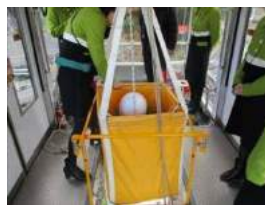
停電時運転（予備エンジン）訓練